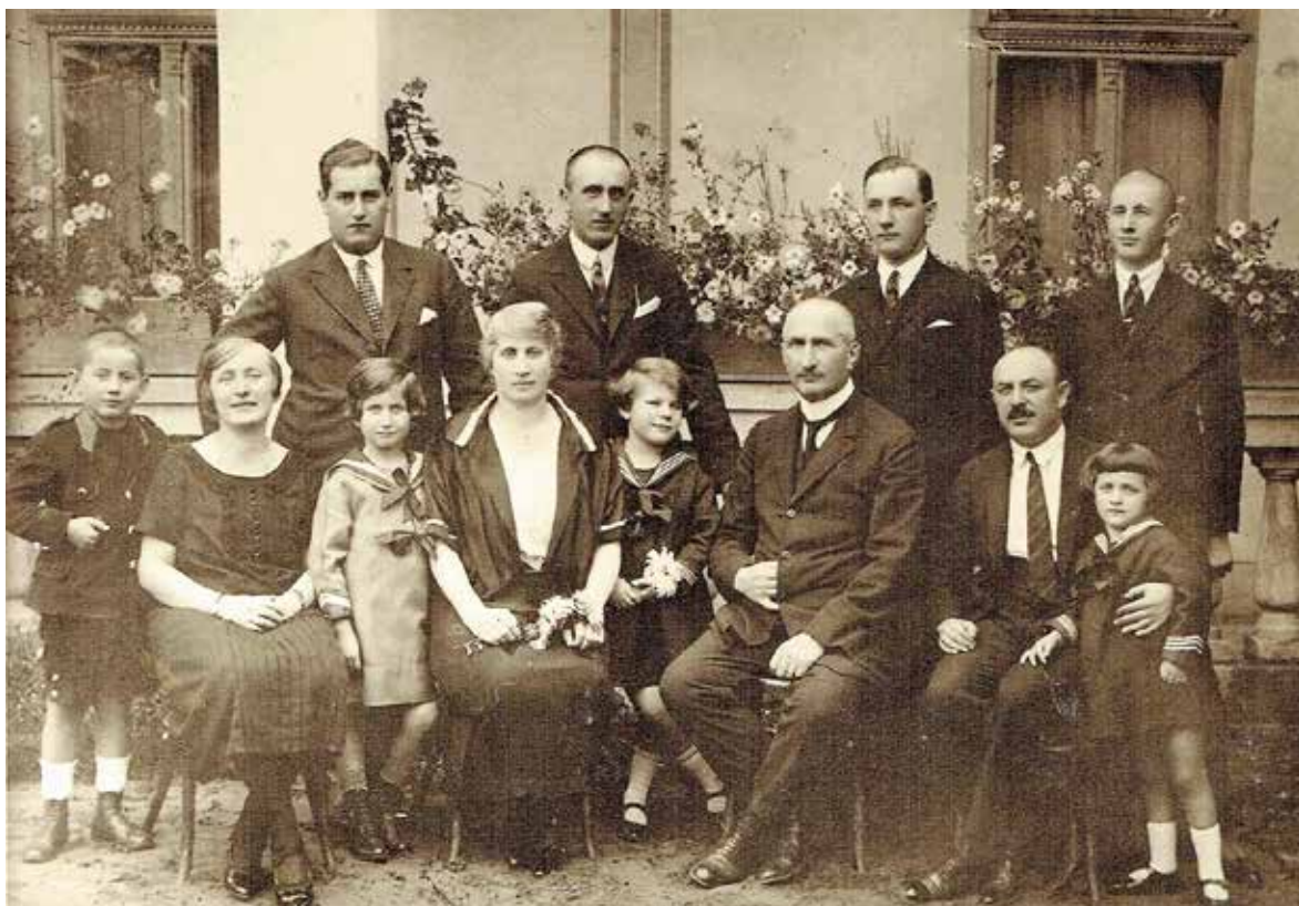
Foto di famiglia, 1924 circa.