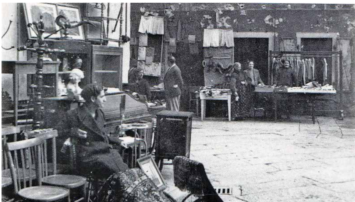
Il ghetto ebraico nella città vecchia di Trieste.